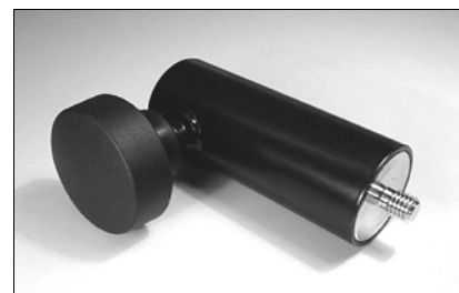
Adapter M10/R38 für Lautsprecherständer adapter M10/R38 for loudspeaker tripod

Technische Änderungen vorbehalten. Subject to change without notice.